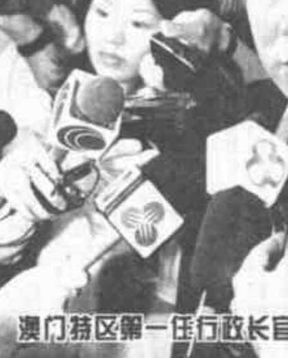
澳门特区第一任行政长官普选提名工作结束

李鹏委员长为再次见到川·立派总理感到非常高兴。他说：“我这次应泰国国会的邀请来访，抵达清迈后受到了清迈府领导人和人民以及上议院议长米猜和国会下院第一副议长颂蓬的热情欢迎和接待。