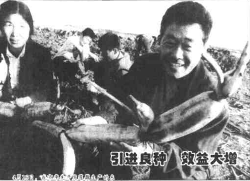
引进良种 效益大增

综合利用和水面养殖为重点，加大科技投入，实现了科技兴渔。1998年他们用于种植作物调整、养殖优良品种推广和科技培训等方面的投入就达20.2万元。他们在田亩上种植高产、优质、高效作物，葡萄、瓜、蔬菜、芦笋花生套种试验获得成功。在养殖上，突出白鲢、全雄罗非、彭泽鲫等名优品种，并做到严把消毒关、鱼苗定购关、科学喂养关和病虫害防治关。二是强化大环境治理的力度，在路边、渠沿、台田种植白蜡、172柳树及其他护坡树木4万余株，项目区全部种植花草美化，同时配套制定了《渔农项目区管护规定》，使渔农项目区逐步成为高效、生态型、园林化旅游观光示范园。（赵玉武 韩振营）